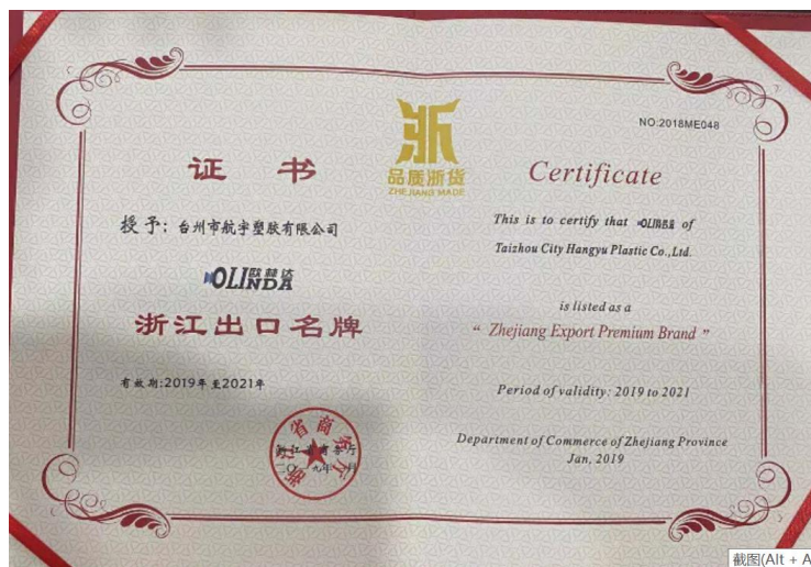
表3.3-2 公司诚信经营的成果

公司高层遵循“人无信不立，厂无信不存”的诚信共赢思想，从组织结构设计、工作流程优化、规章制度完善等方面为公司守法诚信经营创造了一个良好的环境，并在日常工作中带头践行。公司被授予台州市级高新技术企业、浙江出口名牌、2020年台州湾新区十强外贸出口企业，如图 3.3-1 所示：